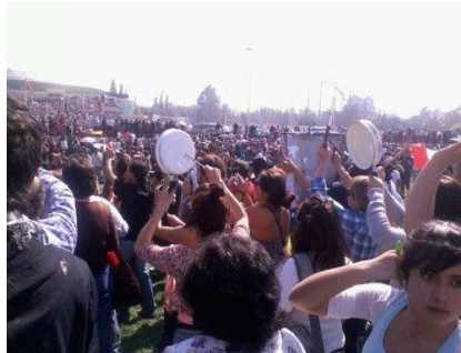
Estudiantes cacerolean en la Parada

A nadie, entonces, debe extrañar que los estudiantes hayan repletado las calles junto a los trabajadores afiliados a la CUT. Es la tradición, la historia de ayer y de hoy, que de seguro seguirá mañana, cuando nuestros nietos entren a la Universidad Pública, gratuita y de calidad.